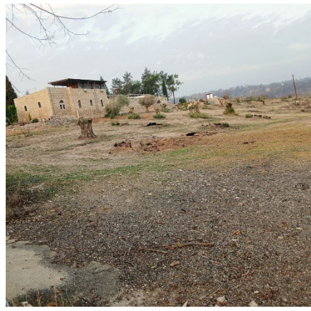
Devant la maison des Frères de Jésus